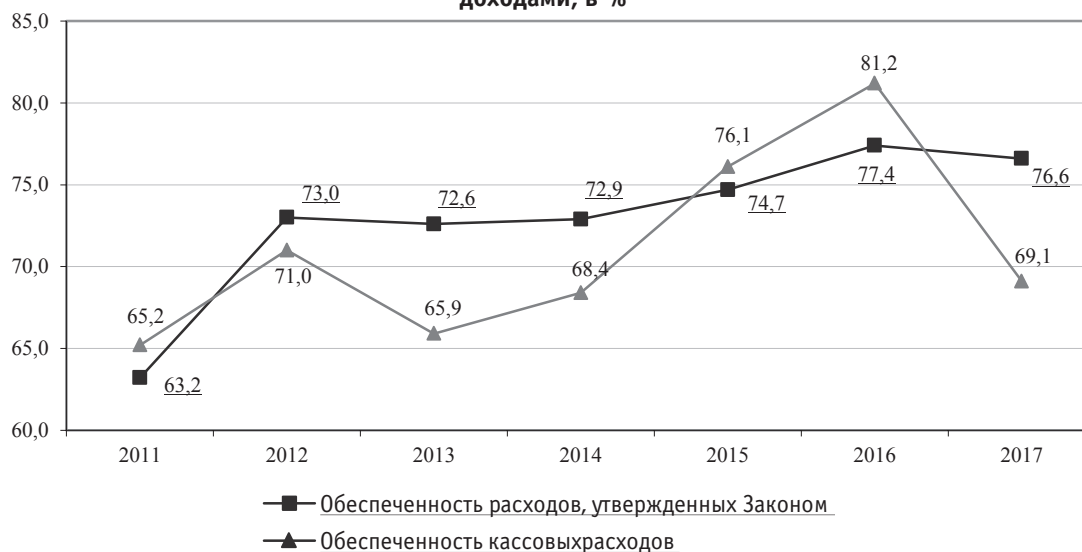
Динамика обеспеченности расходов областного бюджета собственными доходами, в %

Объём утверждённых бюджетных ассигнований по уточненной Сводной бюджетной росписи областного бюджета на 2017 год по итогам года составил 62 407 311,3 тыс.руб. Кассовое исполнение расходов областного бюджета за 2017 год составило 95,98% утвержденных Законом объемов бюджетных ассигнований (исполнение к уточненной сводной бюджетной росписи составило 95,3 %).